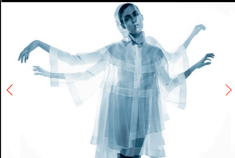
1/6 La camicia bianca secondo me. Gianfranco Ferré