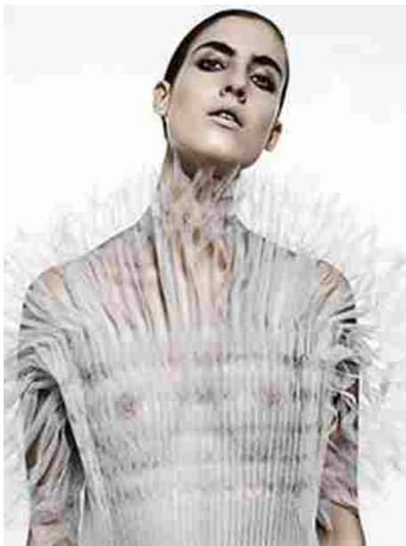
Una camicia Gianfranco Ferré