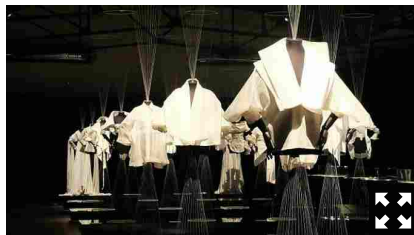
La mostra di Ferrè

Spettacolare allestimento con la curatela del Museo del Tessuto