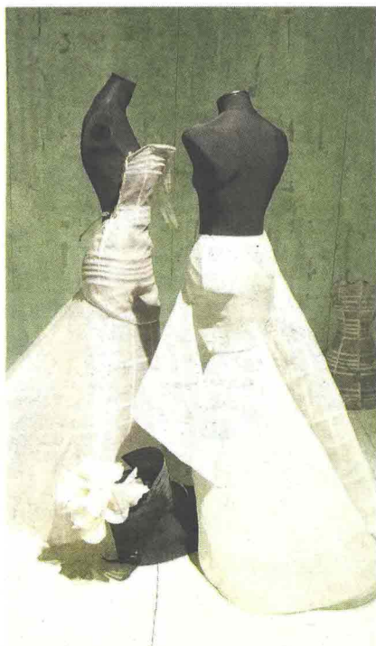
Alcuni modelli usciti dall'archivio della Fondazione Gianfranco Ferré esposti fino al 15 gennaio 2017 al Palazzo del Governatore di Parma. In alto accanto al titolo una creazione di pizzo. Sotto lo stilista nel suo studio.